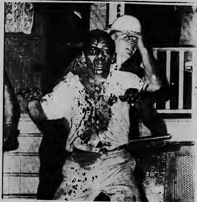
Un manana na sauger, polisnan ta hibando un homber di color warda, despues qu nan mester a interveni den e violencianan racial qu a tuma lugar ayera den e ciudad Newark na New Jersey ayera.- UPI Radiophoto.-

ORANJESTAD - Diavierne mainta mester a presenta dilanti juez e acusado F.C.P. Huntu cu tres otro testigo relaciona cu un caso di amensaa cu cuchu. Caso ta cu ni e acusado ni tampoco ningun di e testigonan no a presenta. Fiscal Sr. S.H. Tjong Ajong a pidi juez pa suspende e caso aki te dia 28 di e luna aki ora cu polis lo hafia orden pa bai busca tur e personanan aki y trecenan dilanti juez.